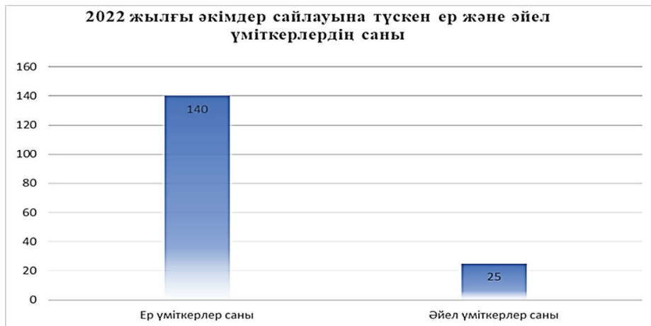
2-сурет. Сайлауға түскен кандидаттар саны

Сайлау барысында, саяси партиялардан және өзін-өзі ұсыну жолымен сайланатындықтан саяси аренда бәскелестік дамиды. Ауыл әкімдерін сайлау қазақстандық демократиялық институтты жетілдірудің басты принципі және жергілікті жерлерде орын алатын әртүрлі мәселелерді шешудің жолы ретінде жалғастырылуды қажет ететін институт екенін дәлелдейді.