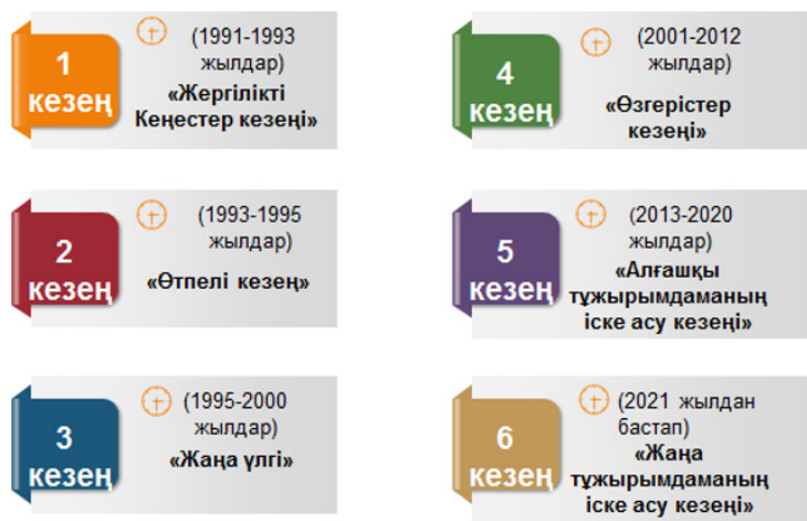
1-сурет. Жас топтары бойынша адамдардың өміріндегі саясаттың маңыздылығы

Еліміздегі жергілікті өзін-өзі басқару институтының қалыптасуының бірнеше кезеңдерін бөліп көрсетуімізге болады (1-сурет).