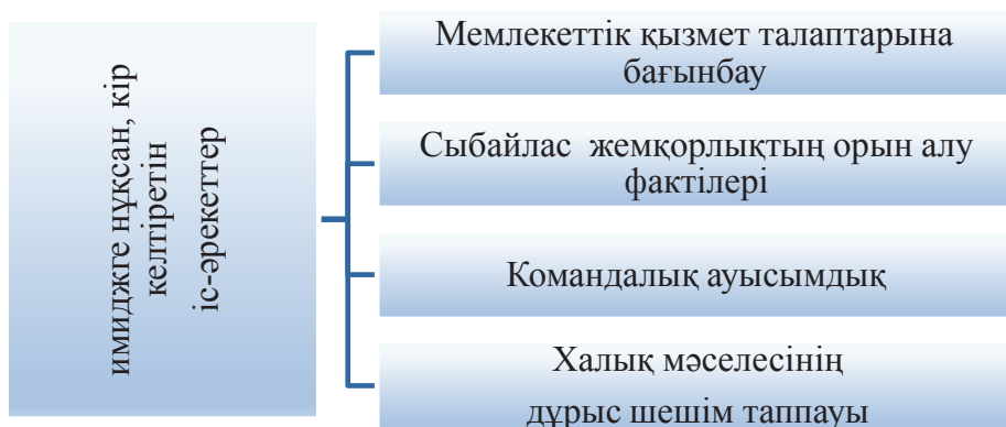
2-сурет. Мемлекеттік аппарат имиджіне кері әсер етуші іс-әрекеттер топтамасы

Алайда, мемлекеттік аппараттың имиджіне нұқсан, кір келтіріп жатқан іс-әрекеттер жеткілікті (2-сурет):