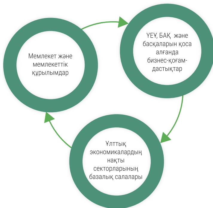
1-сурет. Орталықазиялық аймақтың қауіпсіздігі мен даму стратегиясының құрамдастары

2-кестеде көрсетілгендей, ОА елдерінің ресурстық әлеуеті өте зор. Өзбекстан, Қазақстан, Түркменстан негізінен көмірсутектерді экспорттайды, Қырғыз Республикасы мен Тәжікстан орасан зор гидроэнергетикалық әлеуетке ие. Уран және газ ресурстары бойынша аймақ әлемдегі көшбасшы орынға ие.